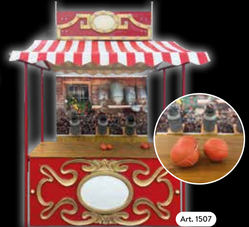
Spielstand »Milchkübelwerfen« Klong. Wer versenkt die meisten Bälle?