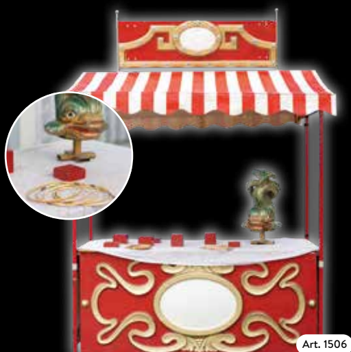
Spielstand »Altes Ringwerfen« Mit Ringen Preise auswerfen. Individuell zu bestücken.