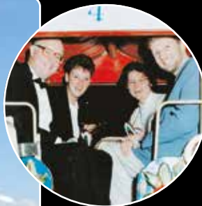
Riesenrad »Kleine Wolkenreise« Fünf Gondeln für stimmungsvollen Genuss. In der Riesenrad-Gondel ist Spaß angesagt! 20 Erwachsene oder 30 Kinder.