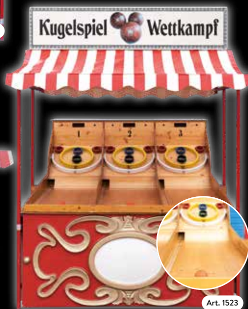
Spielstand »Kugelspielwettkampf« Für 3 Mitspieler.