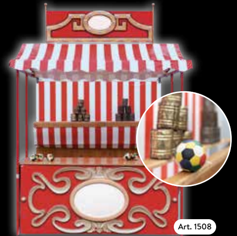
Spielstand »Dosenwerfen« Der Klassiker unter den Spielbuden.