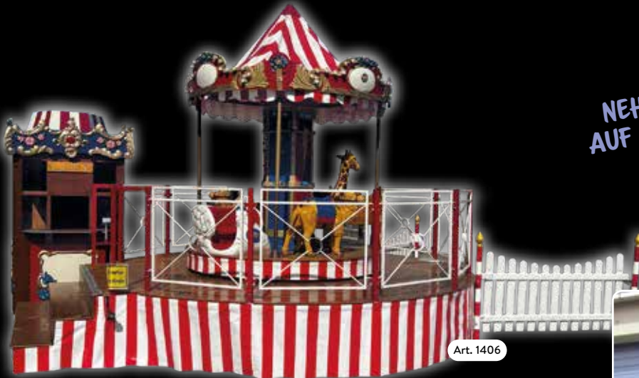
Handdrehkarussell Tolles Erlebnis für die Kleinen.