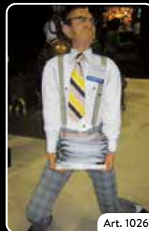
Prospektständer »Werbeleiter Willi Sparbier«

Ideal zur Begrüßung mit Namensschild Ihres Vorstandes etc.