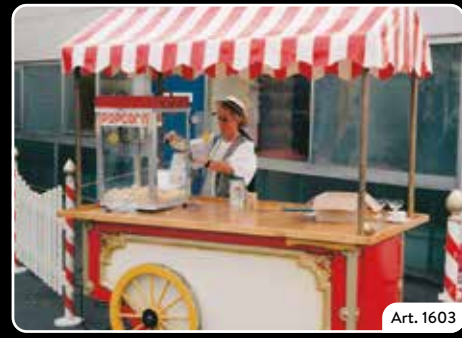
Marktwagen Für verschiedene Zwecke. Individuelle Zusammensetzung möglich. Oder mit Popcorn – Zuckerwatte – Mandeln – Maroni.