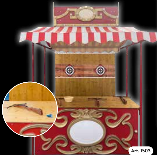
Spielstand »Armbrust« Ein nostalgisches Erlebnis. Eine neue Erfahrung für Ihre Gäste.