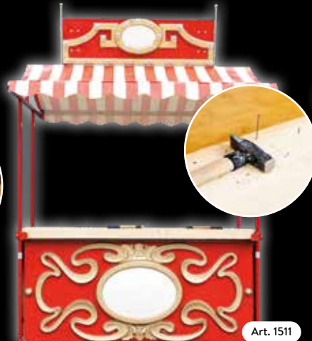
Spielstand »Historische Küchenworbude« Hier wird altes Geschirr zerdeppert. Das Ereignis, bei dem die Tassen fliegen.