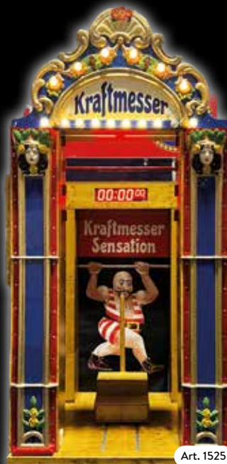
Kraftmesser Wer ist der Stärkste! 1,5 x 1 x 2,5 m.