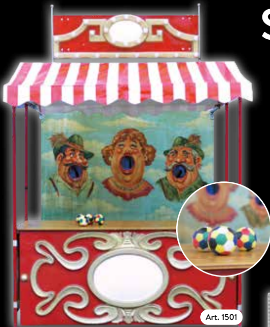
Spielstand »Altes Wurfspiel« Da bleibt mancher Ball im Halse stecken.