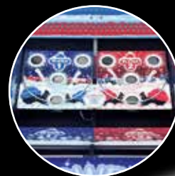
Zirkusspiel-Wettkampf Auch im Basketball- oder Schneeballschlacht-Design möglich. 2 x 2 x 2,3 m.