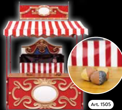
Spielstand »Lustiges Zylinderwerfen« Mit auf- und abgehenden Köpfen.